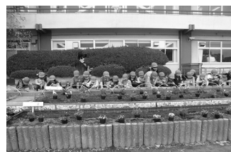
1年生による球根植え付け

次年度の入学式に花いっぱいになるように、植木鉢や花壇にチューリップの球根を植え付けた。