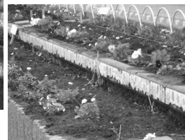
花いっぱいの花壇