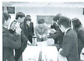
埼玉大学とのコラボレーション講座(理科)