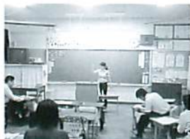
SS(スクールサービス)研修(国語)