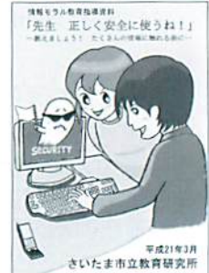
平成21年3月 さいたま市立教育研究所 情報モラル教育指導資料